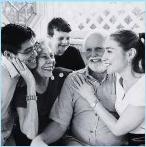
Gesprekken over familie